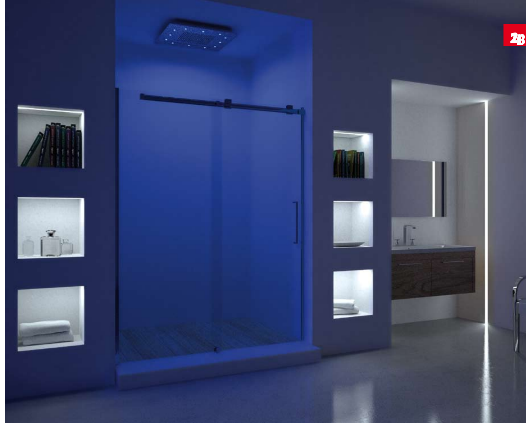
Serie OPEN AIR 8 mm - Art. 02B

Suggerimenti di qualità, con l'eccellenza che da sempre contraddistingue la produzione 2B Box Docce.