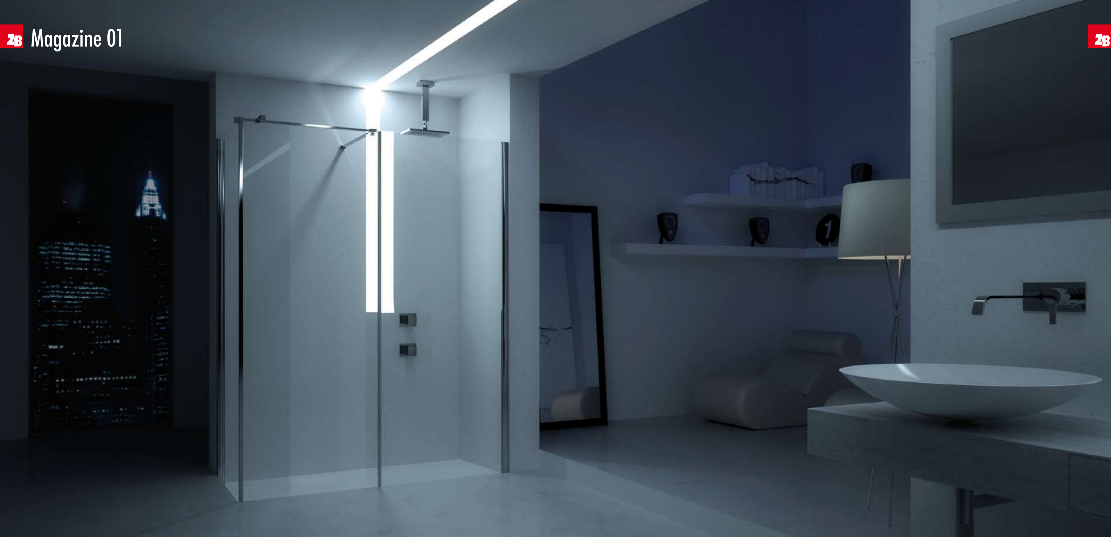
Serie OPEN AIR 6 mm - Art. 083/085