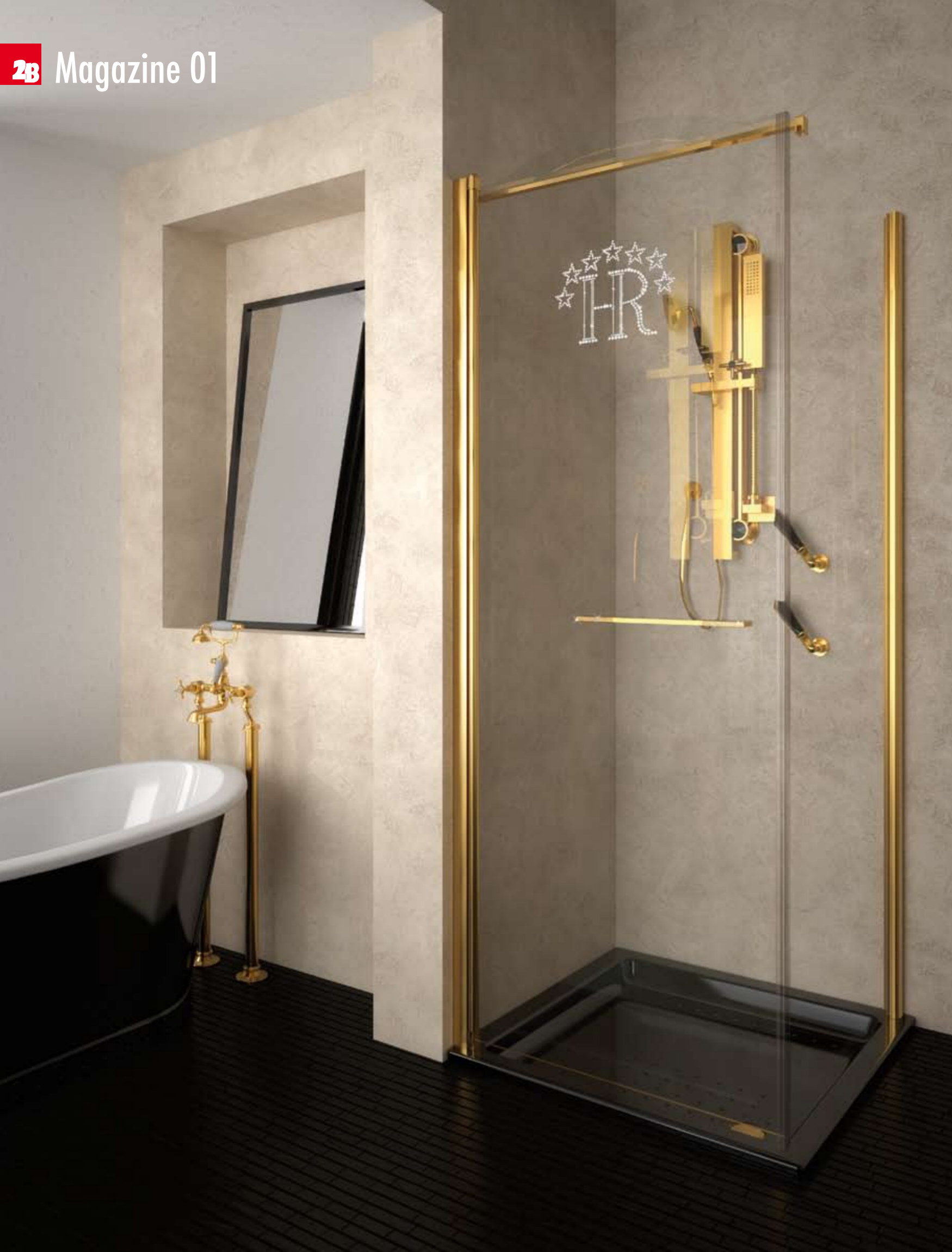
Serie IBIS GOLD - Art. 82C

Suggerimenti di qualità, con l'eccellenza che da sempre contraddistingue la produzione 2B Box Docce.